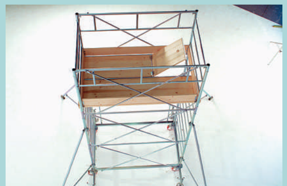
548 HD "EUROSTANDARD"