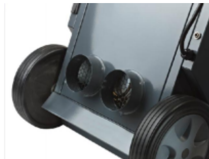
Modely CDT 30 S a CDT 40 S jsou vybaveny topným článkem o výkonu 1 kW, vysokotlakým ventilátorem a dvěma přírubami na potrubí, které umožňují připojení dvou flexibilních vzduchovodů Ø100, každý o délce až 5 m.

Mobilní odvlhčovač CDT lze dodat s kazetou pro čerpadlo kondenzátu namontovanou namísto nádoby na vodu. To čerpá kondenzovanou vodu do odtoku. Při použití tohoto čerpadla kondenzátu nebude váš odvlhčovač vyžadovat údržbu, protože nebudete muset vyprazdňovat těžkou nádrž zaplněnou vodou. Výška hladiny je max. 4 m. Kazeta pro čerpadlo kondenzátu je k dispozici jako příslušenství.