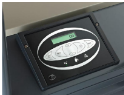
Digitální displej s integrovanou regulací vlhkosti, čítačem energie, stavem provozu a snadným zjištěním poruchy umožňuje optimální odvlhčování.